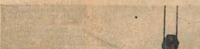
Colocación de unas de las placas en el techo de un edificio.