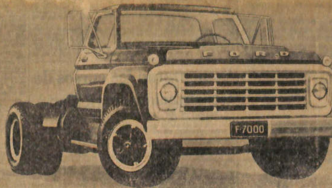
Centro Argentino Publicidad

Sociedad Franklin. Biblioteca Popular San Juan - Argentina (Cel: 264 4602443)