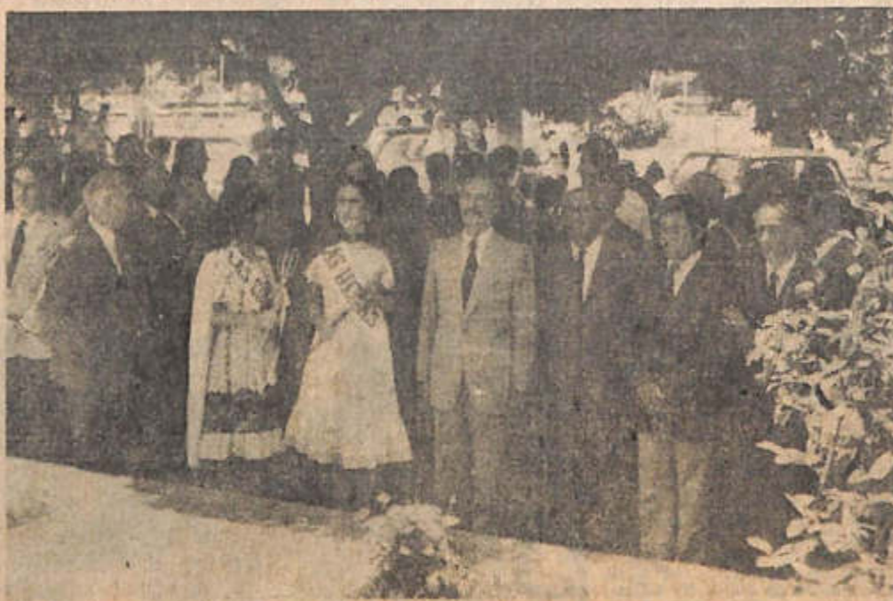
Autoridades presentes durante el acto conmemorativo del Bicentenario del natalicio del General San Martín.