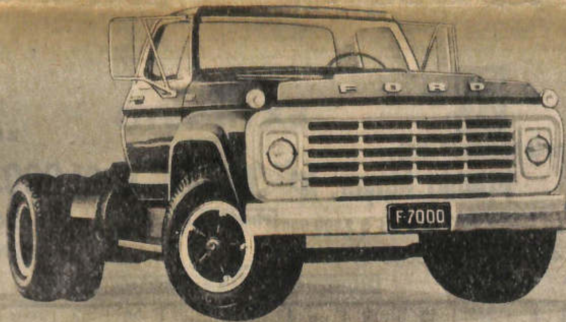
Castro Anselmo Publicidad