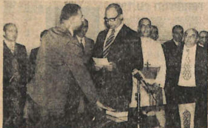
El ingeniero Guillermo Federico Káll, presta juramento como ministro de Obras y Servicios Públicos.