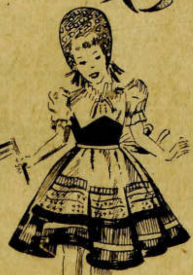
LA BELLA HOLANDESA, traje compuesto de blusa, delantal y gorro de algodón, blanco, pollera de tela floreada de algodón, corselete de terciopelo negro, 10 a 12 años $ 23.50, e e e