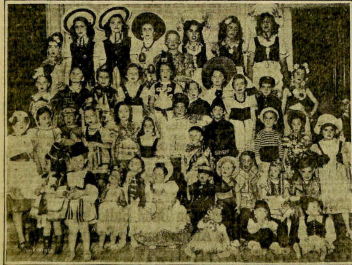
Dos conjuntos con algunas de las muchas máscaras infantiles que visitaron ayer LA PRENSA

Centro Asturiano de Buenos Aires, en Sols 485; Círculo de Aragón, Estados Unidos 1532; Club Arquitectura, Campo Salles 1323; Niños, Club Almagro, Gascon 552; Club Ausonia, Jorge Newbery 2818; Club Archipiélago Canario, Yerbal 2250; Asociación Filodramática Apolo, Bolognes-sur-Mer 547; Club Astor, Santiago del Estero 1243; Círculo Almeriense, El Cano 4025; Club Social y Deportivo Bolívar, Perú 318; Club Atlético Barracas Central, avenida Vélez Sarsfield 67; Club Atlético Banco Español del Río de la Plata, Villanueva 970; Club Atlético Banco de la Provincia de Buenos Aires, Barraviciotti 803; Vicente López; Club Social Mariano Beato, San Juan 3545; Club Atlético Barracas Juniors, Río Cuarto 1400; Brazil Football Club, calle Thoin 1603; Club General Balcázar, Balcázar 1250; Club Brisas del Plata, Constitución 318; Hondo Club Bonorino, Lasituro 685; Club Social de Barracas, Montes de Oca 1817; Club Náutico Buehador, en