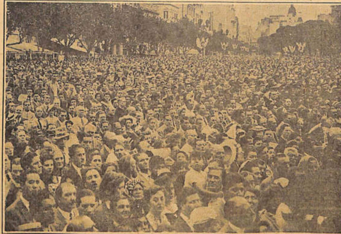
Parte de los asistentes al funeral oficiado ayer en la plaza del Congreso

La banda municipal y el coro y orquesta de profesores de la Academia