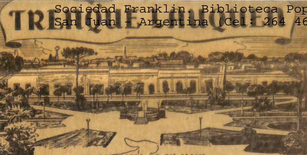
EN LA PALMA DE SU MANO