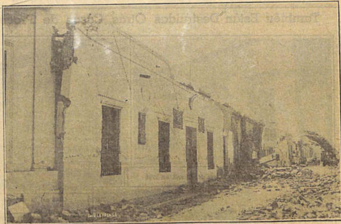
Estado en que quedó la casa donde nació Sarmiento

El Cuartel Maestro General del Interior, por intermedio de la Dirección General de Administración, se ha encargado del envío diario de 30.000 raciones de carne, 15.000 de pan, fideos, maíz, plátano, harina de maíz, porotos, semola, azúcar, yerba, café, sal, papas, verdura, leche, huevos, etcétera. Además, de los envíos efectuados desde esta capital federal las guarniciones de San Rafael y Campo Los Andes, en Mendoza; de Mendoza, Córdoba, La Plata, Catamarca, San Luis y otras, colaboran enviando diversos elementos. El batallón de zapadores de San Nicolás está en camino a San Juan para efectuar trabajos de remoción y demolición de escombros a explosivos. El Ministerio de Guerra, con personal, ha efectuado comunicaciones de su secretario, al Director