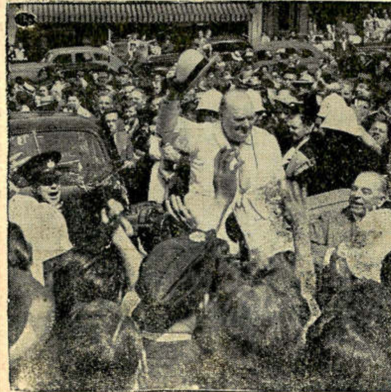
La multitud aclama a Winston Churchill, que en su reciente discurso en los Comunes anunció se está preparando un acuerdo pleno para la post-guerra entre Gran Bretaña, Estados Unidos y Rusia, el cual habría de ser discutido en una reunión que tendrían Roosevelt, Stalin y él, antes de fin de año.