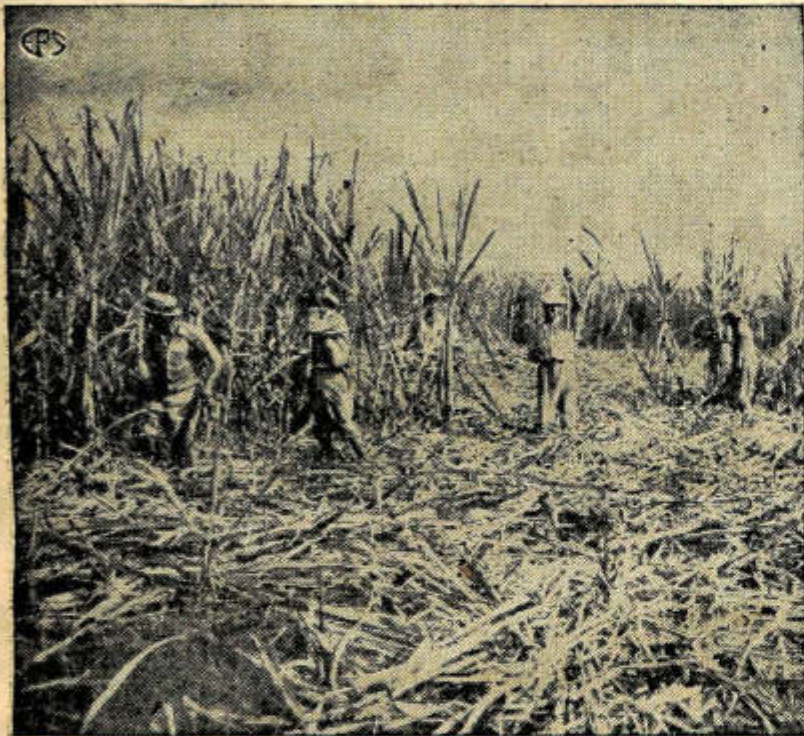
Los despachos de azúcar para los Estados Unidos van en aumento. Vista tomada en un cañaveral de Cuba